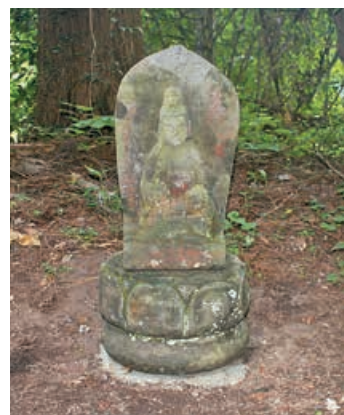
▲猿喰の石造物(持留神社境内右側)

※指定文化財とは 国・県・町の歴史を把握するうえで、貴重かつ重要な文化財に対して価値付し、保護・活用していくもの。