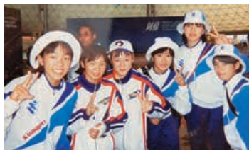
他県の選手と(右から3番目)