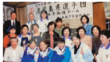
民泊先での写真(前列中央)