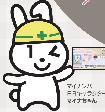
マイナンバー PRキャラクター マイナちゃん