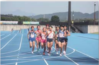
一里山不動産杯小中学生駅伝大会 大隅地域の小学校や中学校のクラブチーム、部活動などが参加し駅伝大会が開催されました