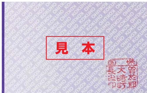
国民健康保険被保険者証(紫色)

8月になっても被保険者証が届いていない場合には、国民健康保険係までご連絡ください。