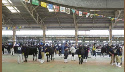
【昨年度の県共進会の様子】