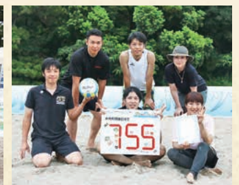
▲ビーチバレーボールの部 優勝 『ANG』のみなさん