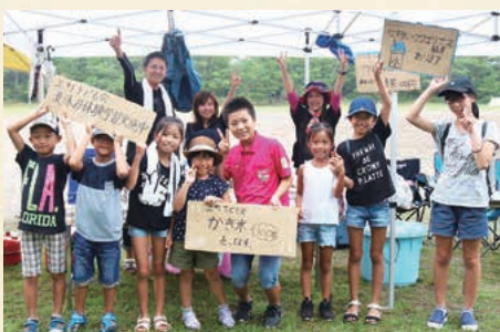
▲会場でかき氷を販売した上町子ども会のみなさん