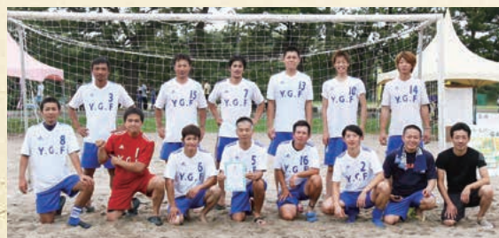
▲ビーチフットサル 一般の部 優勝 『Y.G.F.』のみなさん