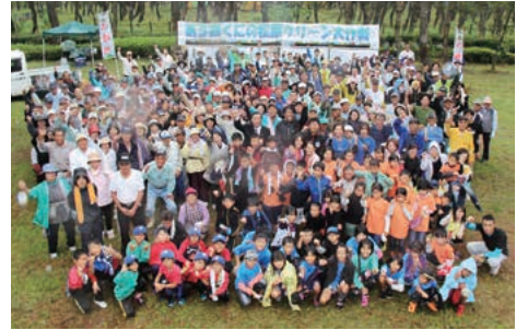
【過去の活動の様子】