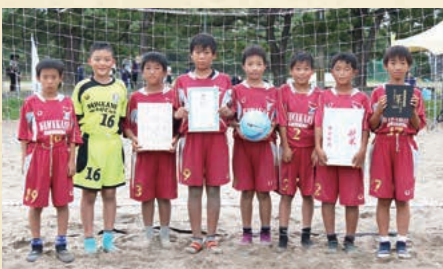
▲ビーチフットサル 小学生の部 優勝 『川上FC U-12』のみなさん