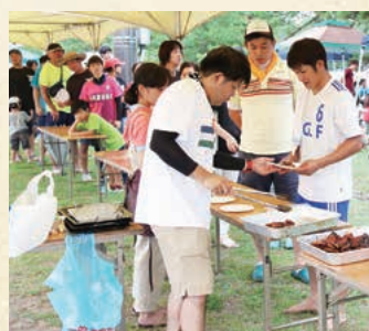
▲うなぎの振る舞いの様子

うなぎの振る舞い 毎年恒例、うなぎのかば焼きが参加者に振る舞われ、配布時には長蛇の列ができました。焼きたてのうなぎのかば焼きを食べた参加者からは「おいしい」など喜びの声が聞かれました。 また、会場内では、上町子ども会の児童らが特製のかき氷を販売し、こちらも参加者から喜ばれていました。