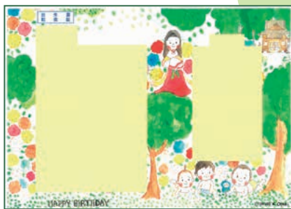
【都萬神社・木花開耶姫命】