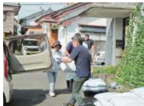
▲昨年の配布の様子