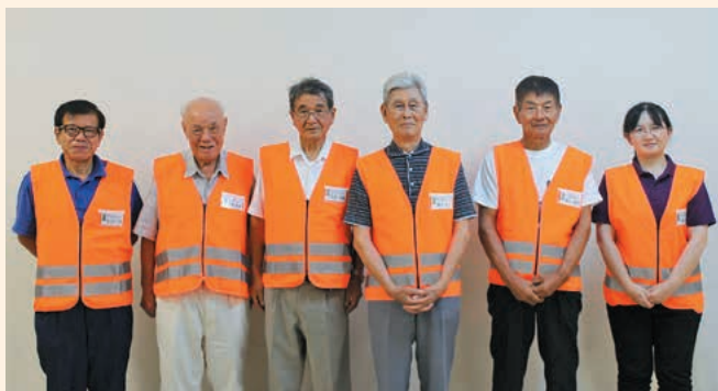
『歴史探学会おおさき』の皆さん