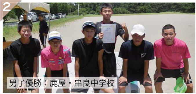
男子優勝：鹿屋・串良中学校