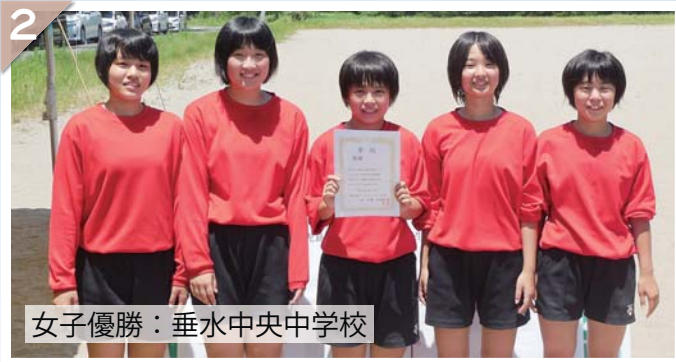
女子優勝：垂水中央中学校