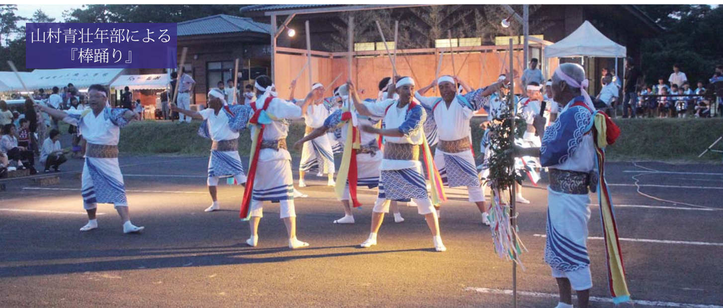
山村青壮年部による『棒踊り』

今年の祭りは、ステージに出店ブース、灯籠と分館・小学校とみんなで協力しあい作り上げたイベントとなり、地域がまとまった夏祭りとなりました。