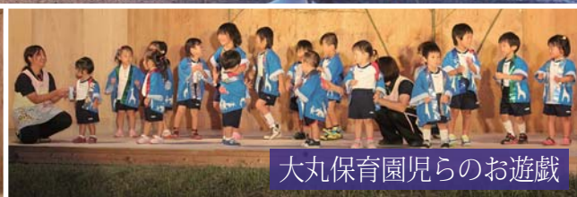
大丸保育園児らのお遊戯