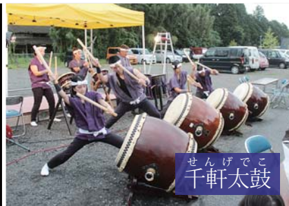
せんげでこ千軒太鼓