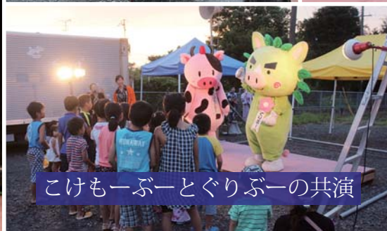
こけもーぶーとぐりぶーの共演