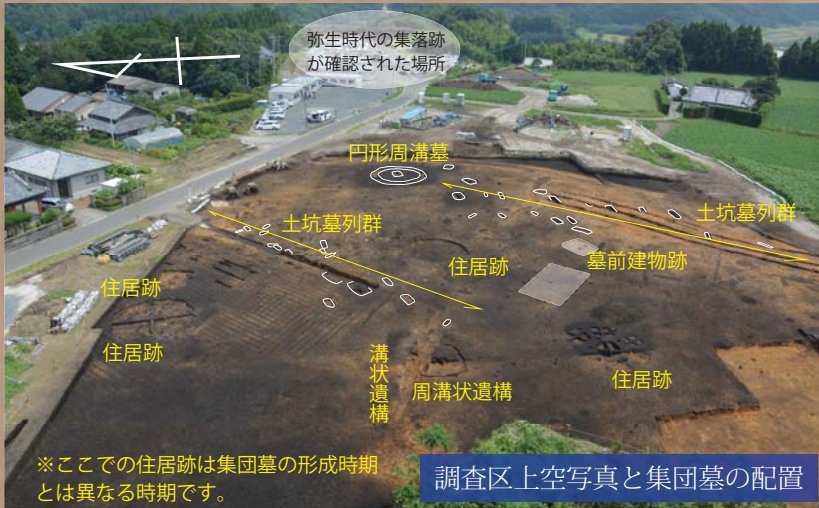
※ここでの住居跡は集団墓の形成時期とは異なる時期です。

集団墓は、遺跡の立地する台地の北側部分にあります。円形周溝墓のある場所を頂点とし、南西と北西側に扇状に広がる下り勾配の傾斜地に墓群が広がっています。ちょうど円形周溝墓から見て、集落が位置する方向と逆側の