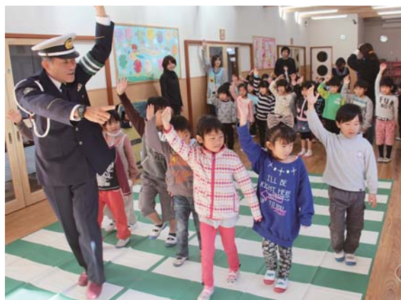
▲横断歩道は手を挙げて確認して渡りましょう！

①『道路に急に飛び出さない！』 ②『道路で絶対に遊ばない！』 ③『車に乗るときはシートベルト、カッチン！』