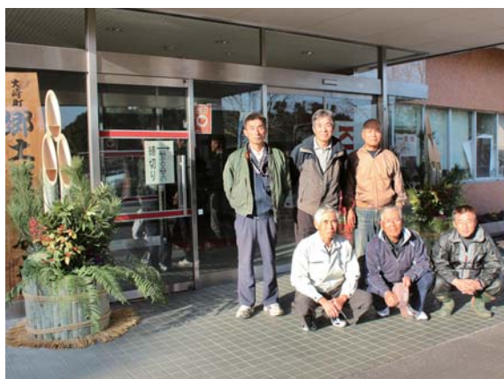
▲門松を製作した各校区公民分館長の皆さん