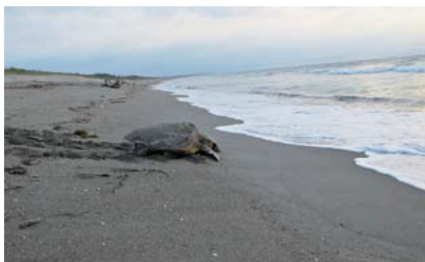
▲産卵を終えて海へ帰るウミガメ

本町では、5月2日（水）に1頭目の上陸が確認されており、8月上旬まで上陸、産卵が続きます。（保護のため、写真は離れた場所から撮影しています。）