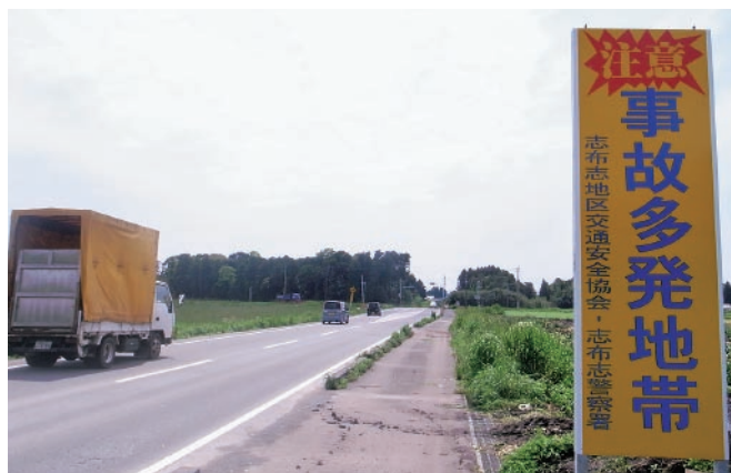
▲スピード注意！事故をなくしましょう！

看板の塗料は、車のライトで反射して夜間にもはっきりと確認できるものとなっています。