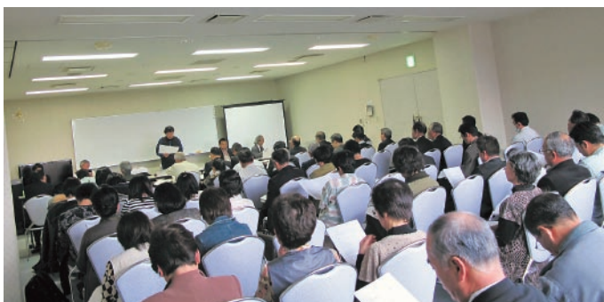
▲参加者から活発な意見が飛び出し大学関係者と有意義な検討会となりました。

今後は特別講座のほか、地域住民等との共同学習や共同調査・研究などを行い、地域社会の課題解決や活性化策の提案等について学生も含めた事業を展開する予定です。