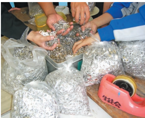
▲集めたプルタブの一部