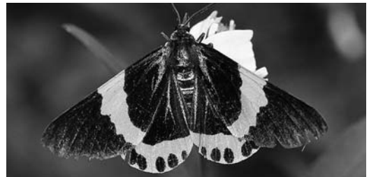
▲キオビエダシャクの成虫