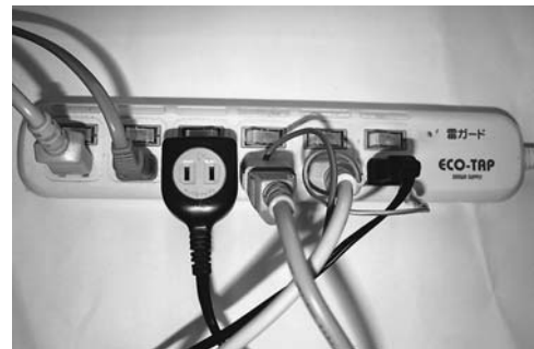
庁舎パソコン等の待機消費電力の削減を図る「省エネタップ」の使用例

○ 主な取り組み内容 ：燃料使用量の削減 電気使用量の削減 用紙使用量の削減 環境への負荷が少ない製品の購入 など