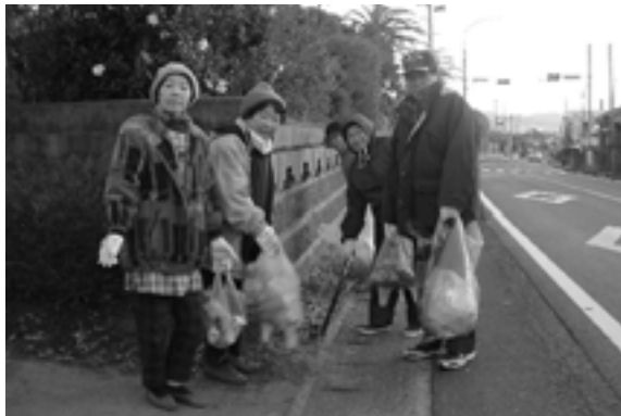
寒い中、多くの町民の方々が『全集落内環境美化ボランティア』に参加されました。(平成17年12月18日)