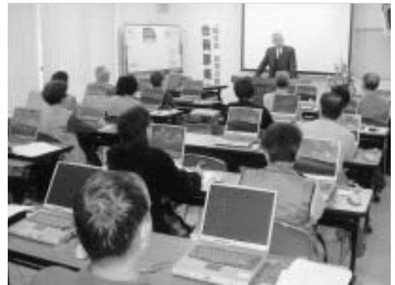
▲パソコン講習会での様子

会員は、年会費を納入します。年額（4月1日～翌年3月31日まで）2,000円です。