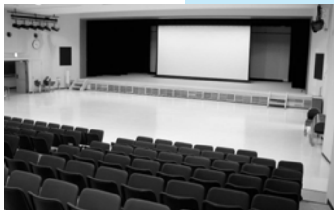
▲大崎町中央公民館大規模改造工事（完成）