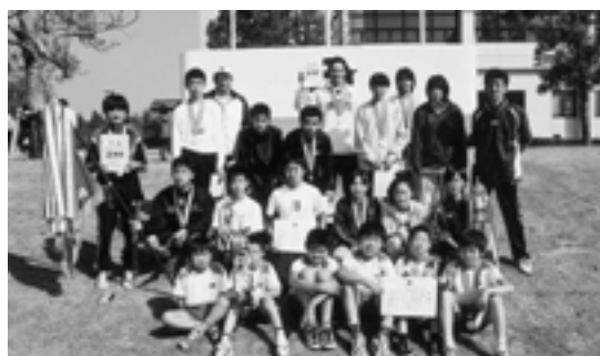
優勝チームの大崎東