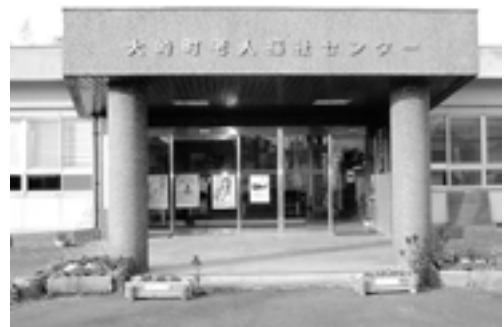
▲大崎町老人福祉センター

また、老人福祉センターを利用される方のために、定期バスも運行しています。詳しくは、下記までお問い合わせください。