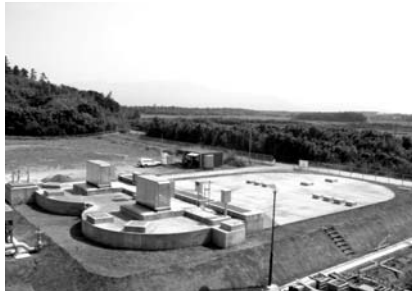
オキシデーションディッチ

公共下水道の終末処理場として整備を進めてまいりました『大崎クリーンセンター』が、このほど一部の工事を残して処理施設ができあがったことを記念して、通水記念式典が行われました。 これにより、今後、当施設においては、大崎町の汚水処理の中核的施設としての役割がますます期待されます。 当日は、地元受益者をはじめ、国・県などから多数来賓のご臨席のもと、盛大に式典がとり行われました。くす玉割りでは、大崎保育所の園児たちも参加し、未来へつなぐ当施設の落成をともに喜びあいました。