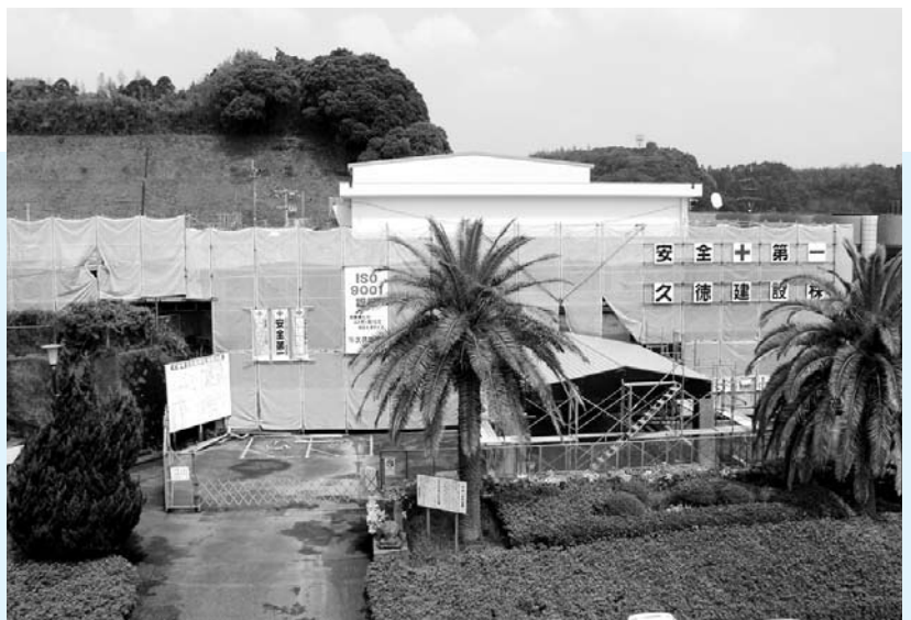
▲中央公民館大規模改造工事