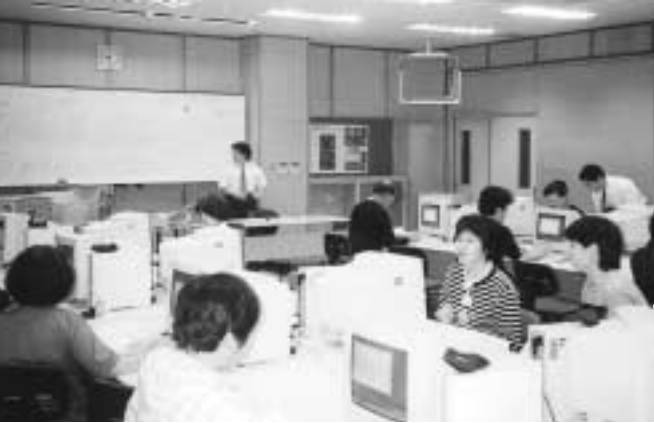
▲らくらくインターネット塾事業（IT講習会）