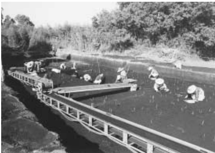
▲埋蔵文化財発掘事業（岡別府・下堀遺跡）

地方自治法第二百四十三条の三（水道事業については、地方公営企業法第四十条の二）の規定及び大崎町財政状況の公表に関する条例の定めにより、平成十三年度の一般会計並びに特別会計の財政状況を次のとおり公表します。 これは、町民のみなさんから収めていただいた税金や国・県からの交付税等の収入、及び支出の執行状況を明らかにし、町の財政に対する理解を深めていただくために公表しているものです。