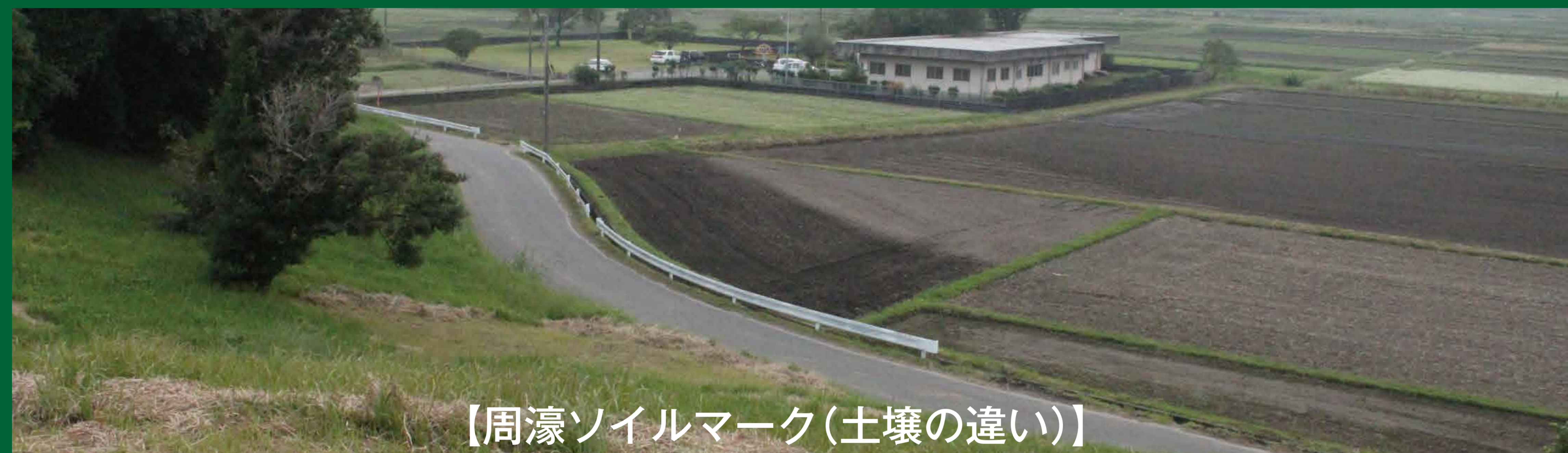
【周濠ソイルマーク(土壌の違い)】