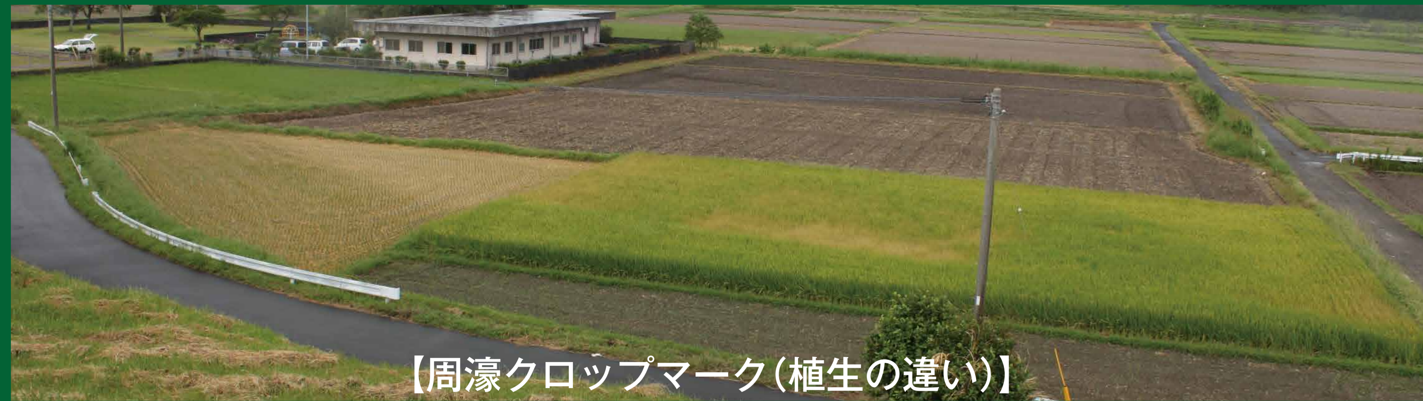
【周濠クroppマーク(植生の違い)】