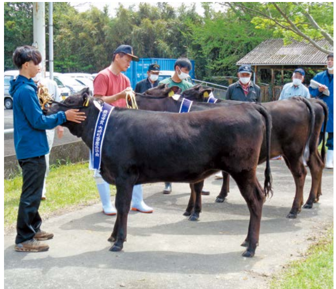
春季畜産品評会受賞の皆さん