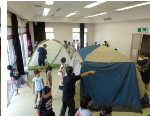
班ごとにテント張り