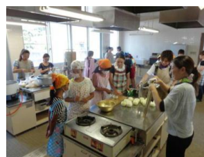
カレー作り(5・6年生)

※ 中沖小・中沖公民分館 合同秋季大運動会は、10月4日(日)に行われます。(雨天順延)