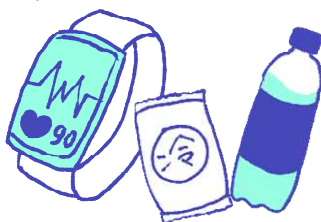
ウェアラブル端末、 応急セット