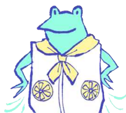
ファン付きウェア、 ネッククーラー