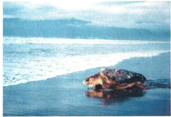
●産卵のため上陸したウミガメ