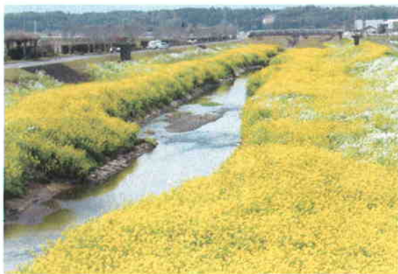
●春になると菜の花一色に染まる持留川河川敷

さらには、基幹産業である農業や農産加工品等においても、地域内の水環境の中で生産されているとともに、文化や風土、日常生活の中で、重要な役割を担っていることから、水の安全性の向上やブランド化といった新たな活用創造が必要です。