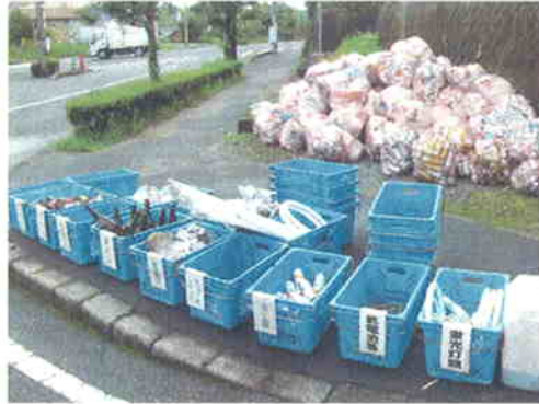
●町民に定着した資源ごみの分別