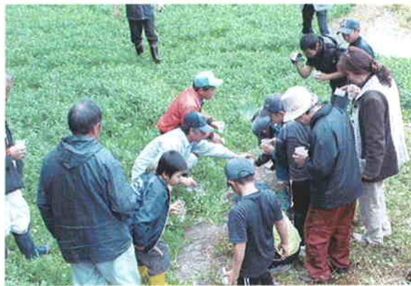
●持留地区の湧水池にホタルの幼虫を放流している様子