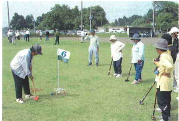
●多目的に利用される運動公園