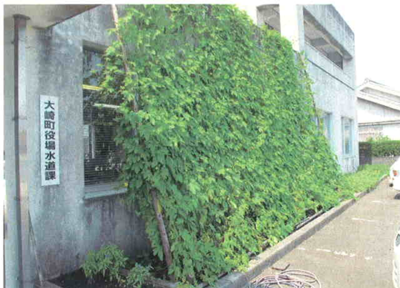
● 夏の日差しをさえぎるグリーンカーテン