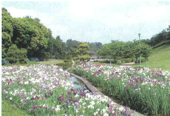
●美しい花々が咲き誇るふれあいの里公園

今後、こうした自然環境と一体化した地域景観を保全するとともに、近年のレクリエーション需要の増大に対処するため、各種機能に応じた公園や緑地を適正に配置し良好な環境づくりを推進する必要があります。