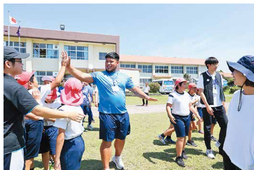
台湾選手と小学生との交流

答 スポーツ合宿者数4万人、観光入込客数を100万人を目標にし、町内の生産者、飲食店、宿泊者に向けてアスリート向け商品開発について説明会を年間複数回開催する計画である。