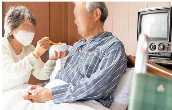
高齢者による家族介護

が支給されている。介護保険を利用し入浴すると1回1万2600円程度かかることが試算できるが、補助金の金額は事足りていると考えるか。