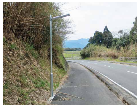
停電でも使える避難誘導灯