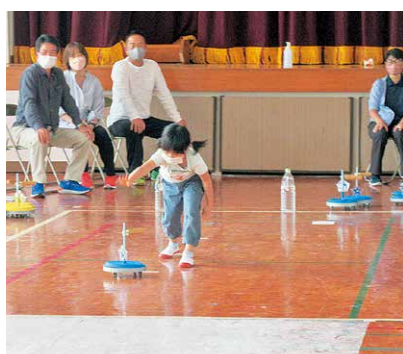
えんがわカーリング (持留地区)

決に取り組む団体に対して必要な助成を行う。対象は、地域づくり協議会、公民分館、自治公民館、NPOなどの団体で、予算は、1団体10万円の2組を予定している。