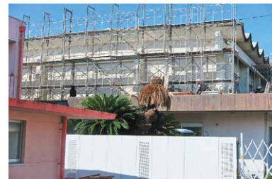
工事着工された屋内運動場

答 工期は140日間、夏季休暇より着手し、1月くらいには使用できる。工事期間中必要であれば、総合体育館を使用することになる。新築との比較は実施していない。照明はLED照明になり、トイレ等の換気も十分考えてあり、多目的トイレも計画に含んでいる。