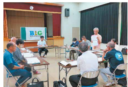
マンガ製作活用検討委員会

答 単年度の計画であり、報告を含めて今年度中に完成を目指している。ページ数は100ページから130ページ程度と考えている。候補者については、複数あったが他の方は情報量が少なかった。