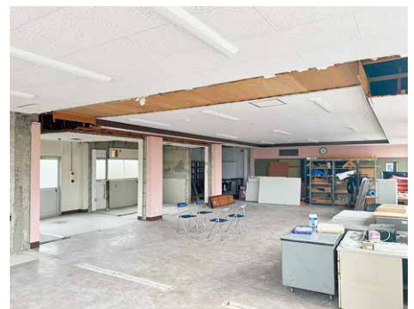
マルおおさき2階 事前着工現場