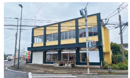
環境拠点整備予定施設「マルおおさき」

答 役場だけでは気付きにくい視点について、多くの方々から意見をいただき、実行可能な組織として、環境拠点整備に向けてこの実行委員会を進めていく。