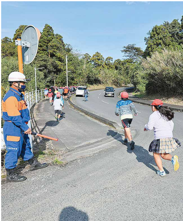
大地震を想定した避難訓練 (大丸校区)