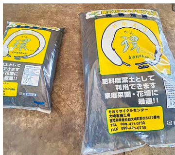
リサイクルにより生成された有機資材

問 本町リサイクルの副産物である有機資材の活用など、実施可能なところから有機農業への関心を少しずつ高めていくべきではないか。