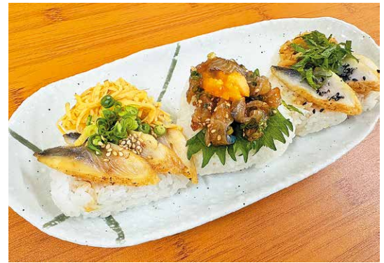
りゅうまん 龍鰻おにぎり

おにぎり屋をオープンしたきっかけは、うなぎはやはり高価なので、おにぎりだったら量もそこまで使わないため、具材にうなぎを使うことで、多くの皆様に安く食べていただきたという思いからオープンしました。