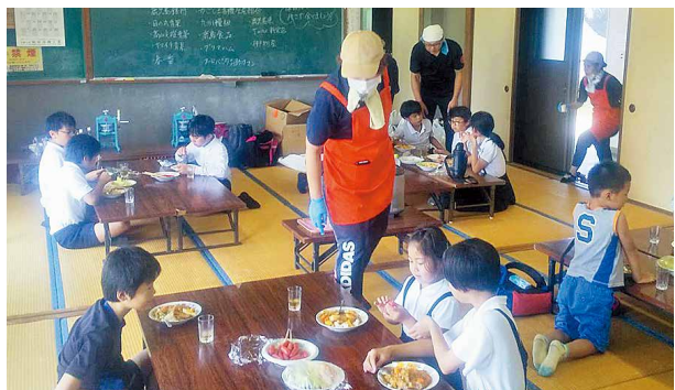
今年度新たに開設された菱田の子ども食堂の様子

答 町長 国の子ども大綱や子ども家庭庁の動向を見ながら、まずは町民の皆様にもホームページ、LINEなどを通して情報を周知していきたい。加えて、放課後児童クラブや子ども食堂などがさらに充実するよう支援したい。本町でも子どもに関する計画は策定予定である。