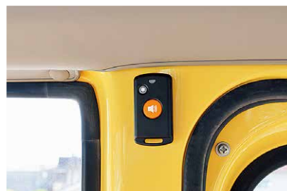
車内に設置された安全装置

答 送迎用で3列目以上の座席を有する車両である。対象となる送迎用バスは、保育所・認定こども園が9台、放課後児童クラブが5台の計14台である。