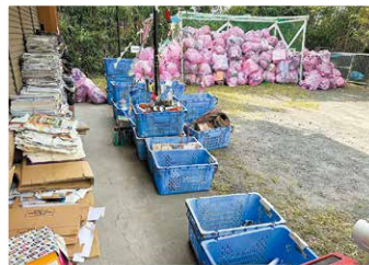
月1回の大量の資源ゴミ