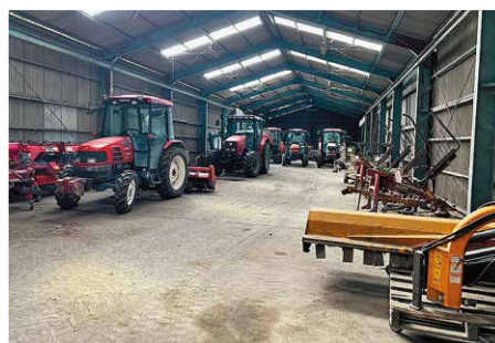
農業機械センター

答 年間約2,900万円からスタートし、人件費の上昇とともに約3,000万円から3,500万円の間に5年間は推移していくと試算している。