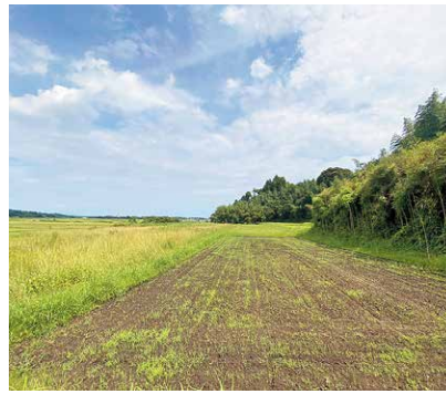
今後の活用が懸念される水田地域

答 町長 農政座談会における説明と欠席者には資料を送付した。さらに交付金申請時にも水稲作付けの可否や、必要に応じて畑地化促進事業の説明及び要望の有無を確認した。