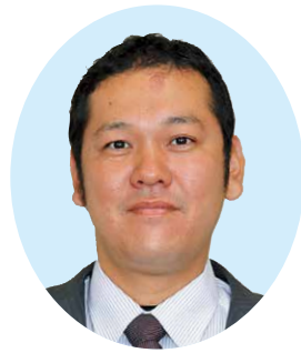
草原 正和 議員