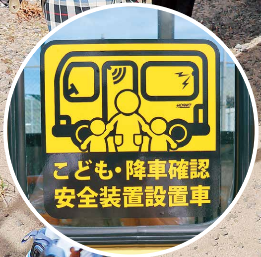
「送迎用車両安全装置」が設置されたスクールバス (関連記事3ページ)