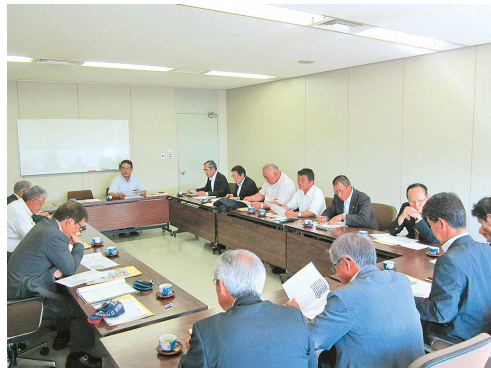
経済連会議室にて

ついて研修を行いました。経済連では畜産情勢について研修し、子牛の頭数や子牛価格の推移状況、新たな担い手確保対策等について説明を受けました。次に、松本商会株式会社では、工場の概要及び再生ペレットの製造工程毎の設備の稼働状況、再生ペレットの出荷状況及び農業用ポリフィルムとペットボトルキャップの持込み状況等について説明を受けました。