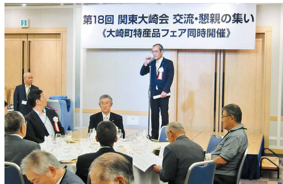
渋谷エクセルホテル東急にて

所長など来賓を含め100名余りの参加を得て、議事も滞りなく進行し、盛会裏に終了いたしました。議会から議長が出席し、本町の動きや議会の活動報告等を行いました。