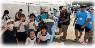
【国体ボランティアお手伝い】